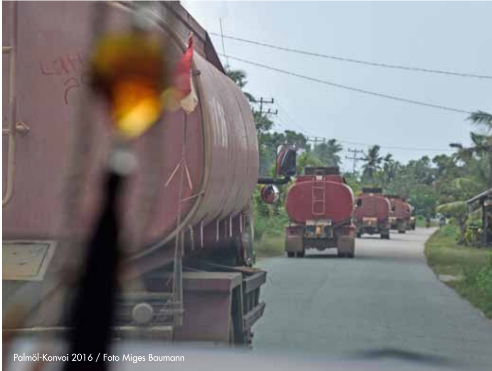
Palmöl-Konvoi 2016

Schweizer Banken und Pensionskassen finanzieren das gewinnbringende Geschäft kräftig mit. Nicht nur unser Konsumverhalten, sondern auch die alleine auf Gewinnmaximierung ausgerichtete Wirtschaft hat also einen direkten Einfluss auf die Lebenssituation der Menschen im globalen Süden und auf die Umwelt.